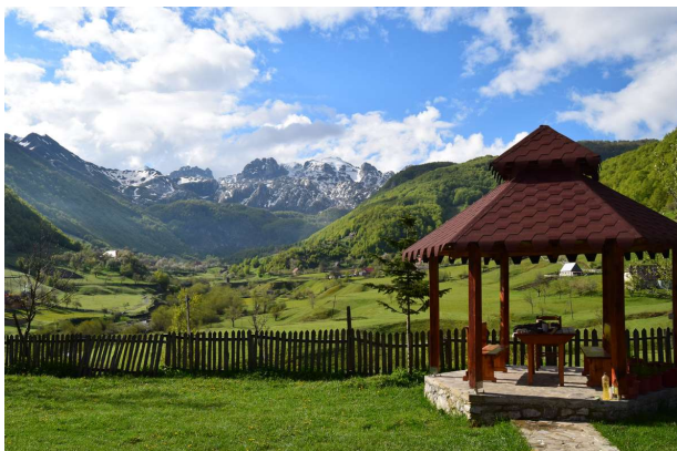
LEPUSHE, en el extremo norte de Albania dónde empezara nuestro recorrido