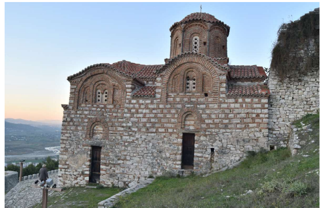
Iglesia de la Santísima Trinidad situada en la parte alta de la ciudad, en los alrededores del barrio Kalaja, en BERAT.