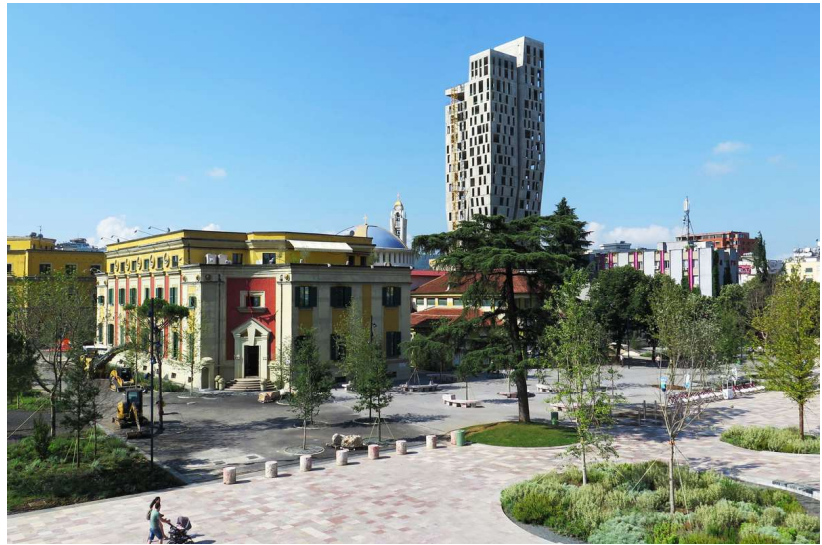
La Plaza Skenderbej esta situada en el centro de la ciudad de Tirana