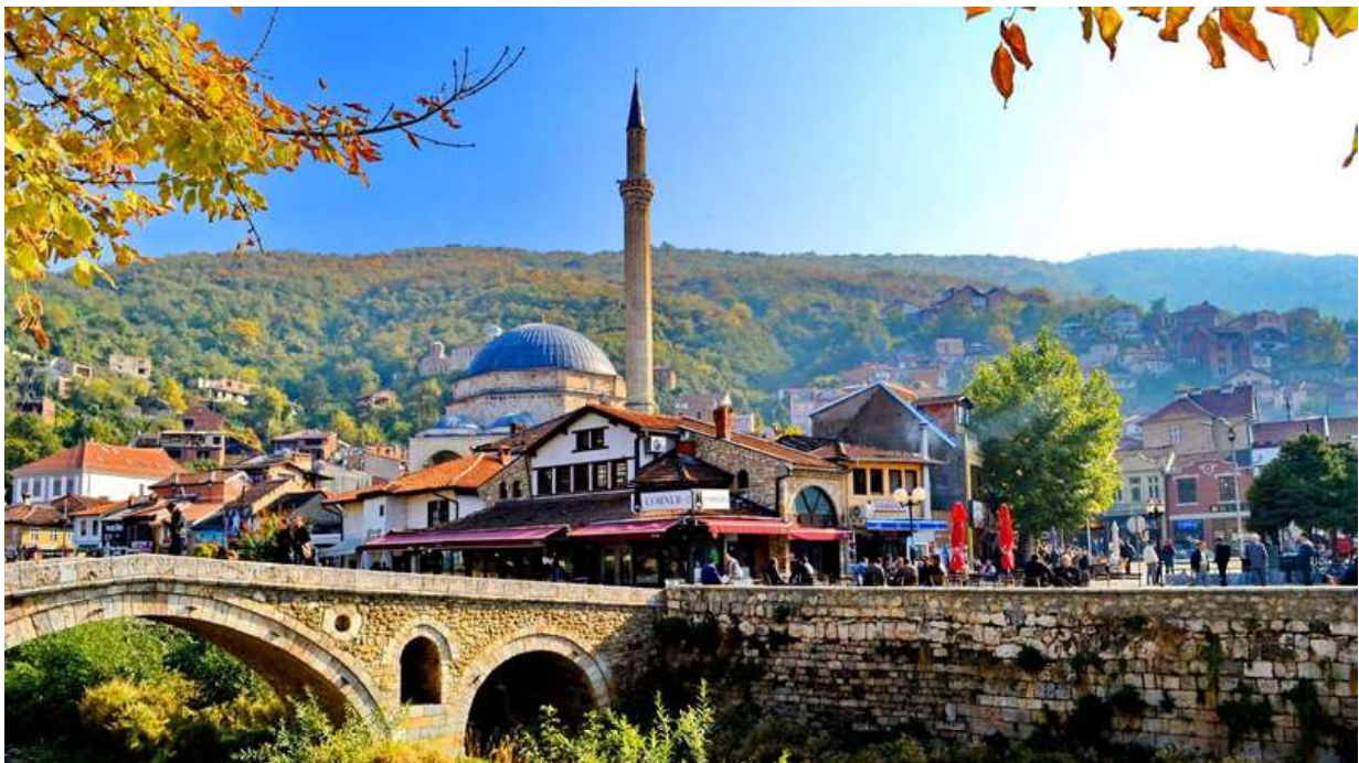
PRIZREN, es una de las ciudades más bonitas de Kosovo por la que pasa la novena jornada del viaje