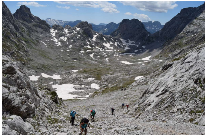
Alrededores de THETH (arriba) Vista de la Iglesia de THETH (izquierda)