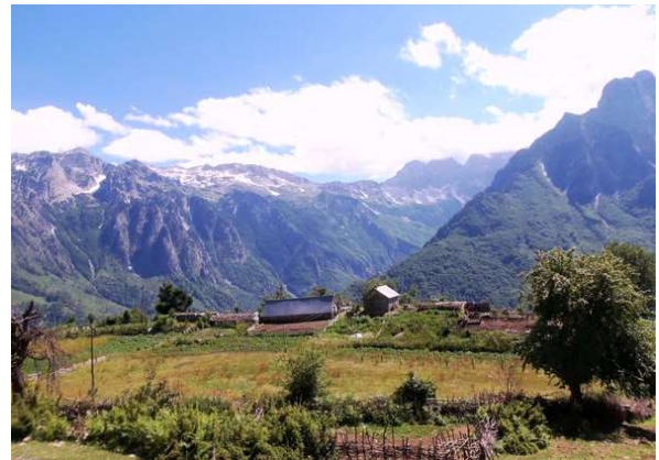
Panorámicas del valle de VALBONA