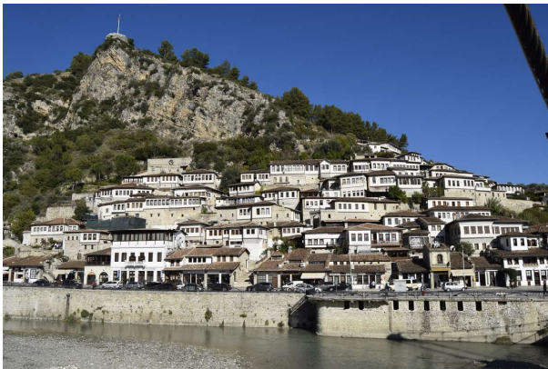
Panorámica del barrio Mangalem en BERAT.