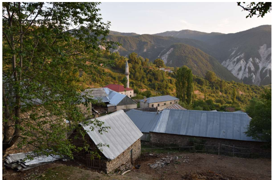
RADOMIRE, base del monte KORAB