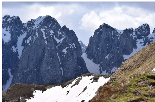
MAJA VAJUSES, paso de la tercera jornada del trekking