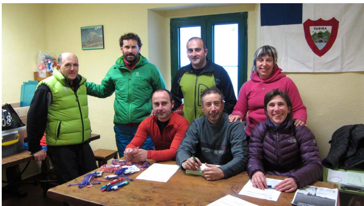
Languntzaileak - Colaboradores