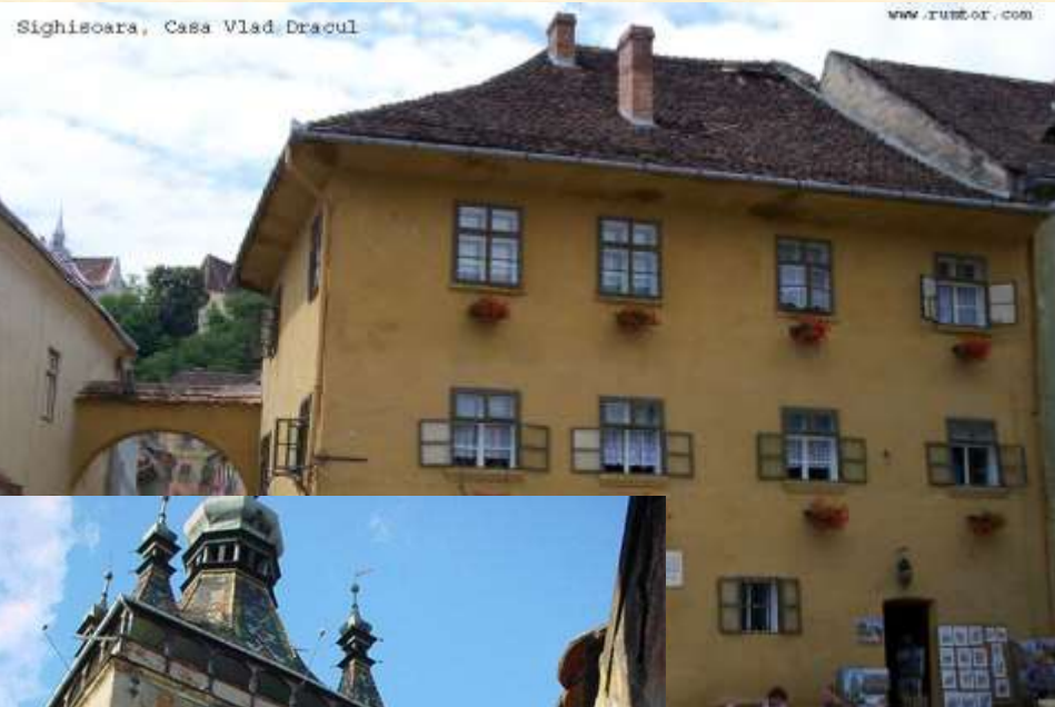
Sighisoara, Casa Vlad Dracul