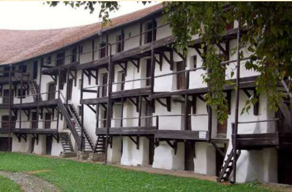
Iglesia-fortaleza de Prejmer.