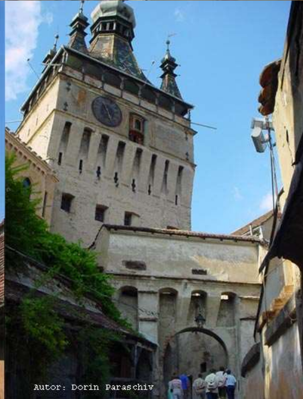
Autor: Dorin Paraschiv