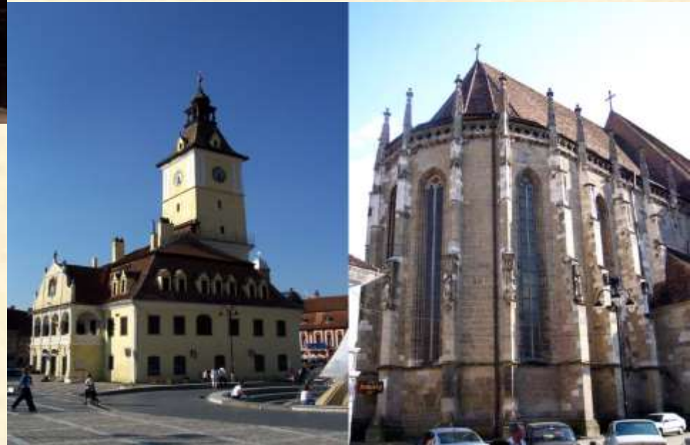
Ayuntamiento e iglesia Negra (Brasov)