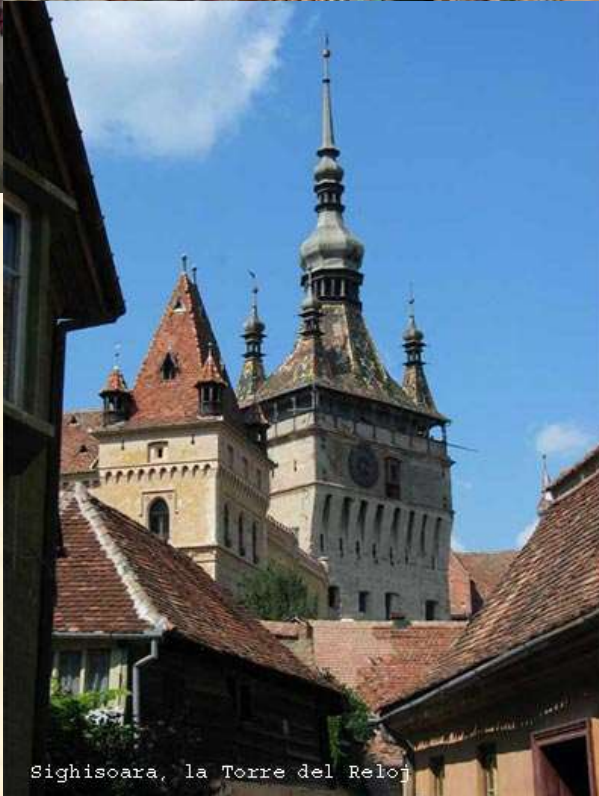
Sighisoara, la Torre del Reloj