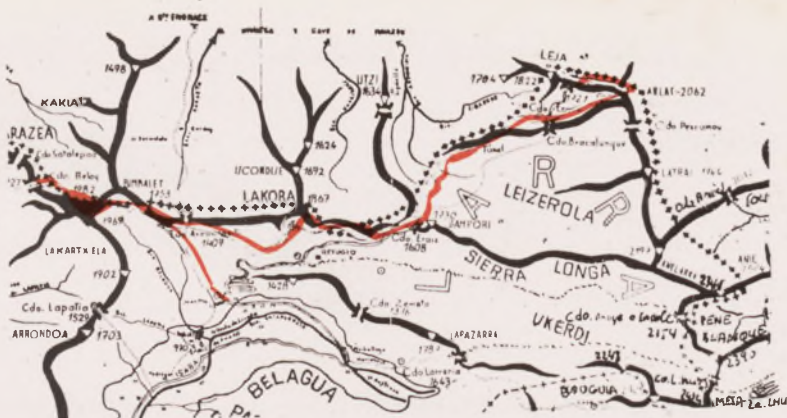
Piedra San Martín - Collado de Belay