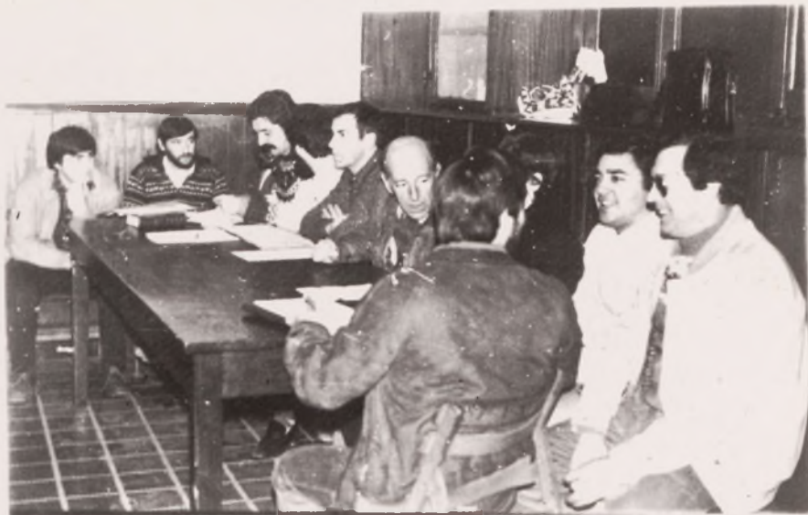
"Parte de la directiva actual"

En el número anterior dábamos cuenta de la primera parte de la Asamblea, en la que la directiva va exponiendo la labor desarrollada a lo largo del año. En esta segunda parte abordaremos las propuestas más importantes que fueron presentadas.