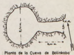
Planta de la Cueva de Bolinkoba