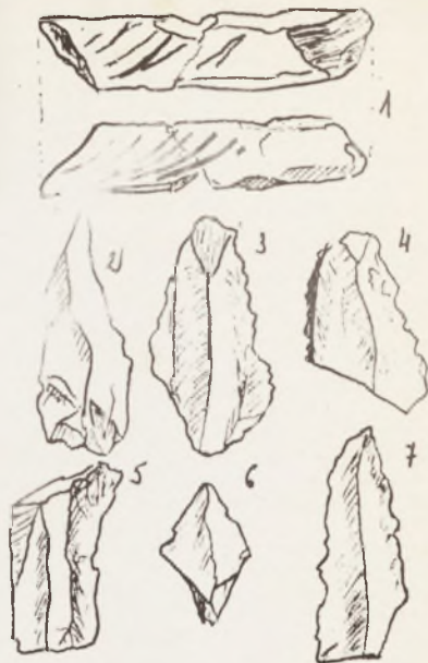
1. Fragmento de hueso con incisiones (tam.nat). 2,3,4,5 y 6. Láminas y puntas líticas (tam. nat.)

Fué un vivac muy agradable, aunque el lecho resultó un poco incómodo. Las nieblas bajas cubrían los valles. El cielo se mantuvo raso durante la noche y gozamos contemplando millones de estrellas que centelleaban en el firmamento. Aunque estuvimos los dos solos, nos sentimos como muy acompañados y rodeados de amigos, ya que antes de dormirnos, intercambiamos unos destellos de luz