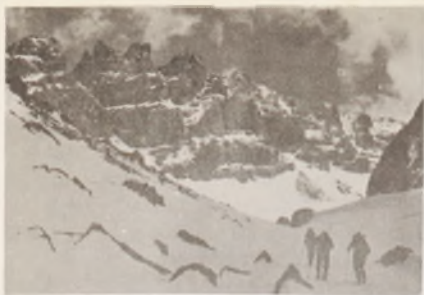
Tizkin, desde el refugio Lepirey