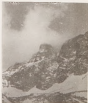
En el Tizi-Melloul, bajo los Clochetons.